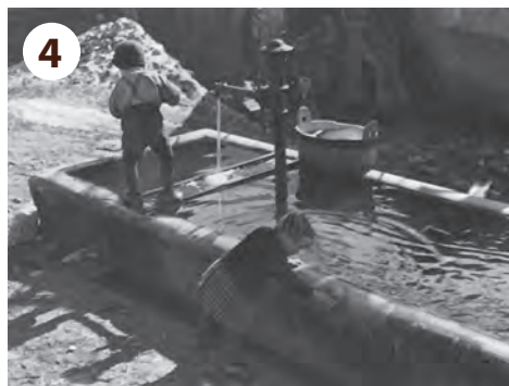
Na klanču je bilo središče naselja. Pri koritu so se igrali, se v bližnjih hišah družili, peli in plesali. Pozimi so igrali hokej, poleti pa namizni tenis.