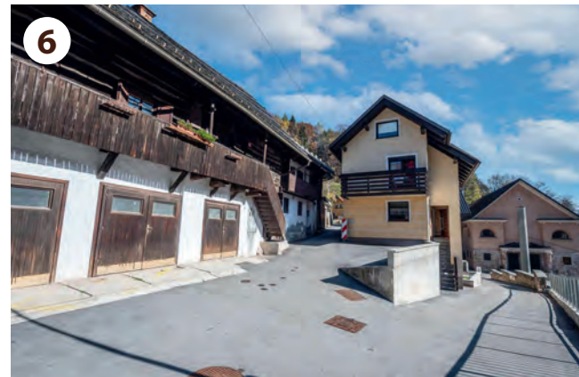
Dve ohranjeni kajžarski hiši z zidanim pritličjem, lesnim nadstropjem in gankom. Na Murovi 18 je bila leta 1825 prva jeseniška (Janezkova) šola.