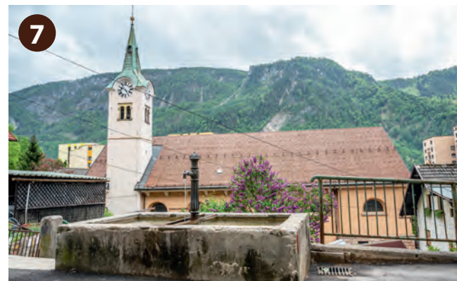
Danes sta ohranjena le še Škafarjevo in Višnarjevo korito. »Pr' Škafar« so včasih izdelovali škafe. Tako hišno ime, ki pove nekaj o gospodarju ali hiši, pomembno ohranja spomin na stare Jesenice.