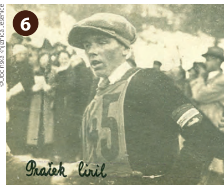
V sosednji hiši je živel Ciril Praček. Med izjemnimi rezultati ima 15. mesto v alpski kombinaciji na zimskih olimpijskih igrah 1936 v Garmisch-Partenkirchnu.