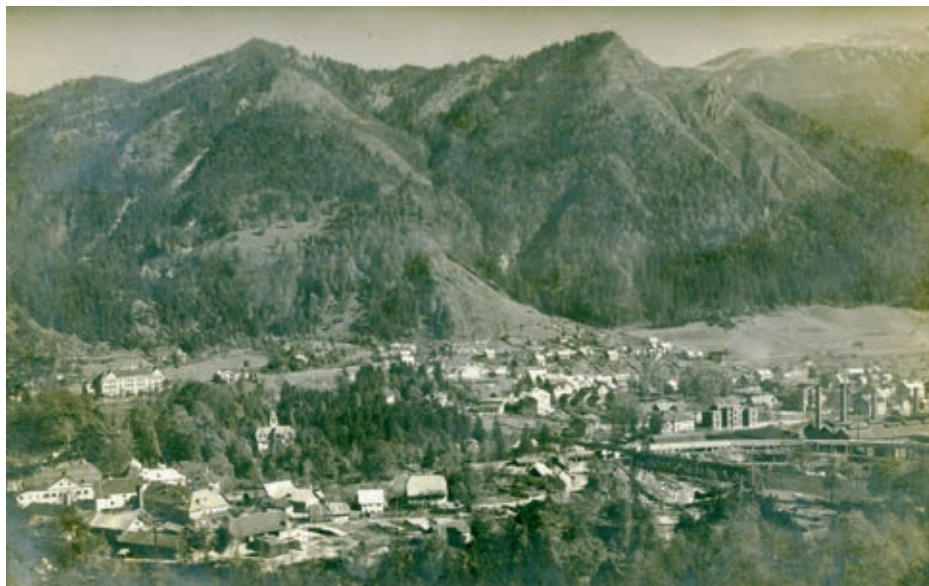
Hrenovca v začetku 20. stoletja

Območje med Staro Savo in Trgom Toneta Čufarja se imenuje Hrenovica, po jeseniško Hrenovca. Ime naj bi dobila po Lenartu Hrenu, ljubljanskem županu in očetu škofa Tomaža Hrena, ki je bil v 16. stoletju fužinar na Savi. Zaradi zadolženosti je svoj delež pri fužini prodal italijanskim fužinarjem Bucellenijem, ki so jih leta 1766 nasledili belgijski fužinarji Ruardi. Na karti iz druge polovice 19. stoletja, ki prikazuje Hrenovco kot gozdnat in rahlo valovit teren z nadmorsko višino med 564 in 571 metri, je označen tudi živalski vrt. Po ustnem izročilu so Ruardi tam imeli jelene, opice in medvedka Mežka. Konec 19. stoletja je Kranjska industrijska družba od Ruardov kupila savsko fužino in zgradila jeseniško železarno. V Hrenovci je uredila športne objekte, sprehajalne poti, v gradiču restavracijo in v štirih vilah stanovanja za svoje višje tovarniške uslužbenke.