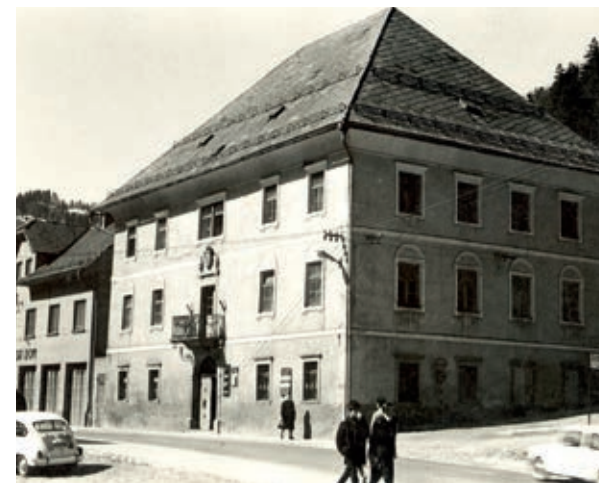
Kosova graščina

Od cerkve se pot spusti do Kosove graščine, nekdanjega upravnega dvorca belopeškega gospostva, ki je bil zgrajen leta 1521. Tristo let pozneje je двореc kupil trgovec in podjetnik Frančišek Pavel Kos, ki mu je dal današnjo podobo in ime. Graščino je v 19. stoletju odkupila jeseniška srenjska uprava in od leta 1883 do leta 1915 je v njej delovala ljudska šola. Med obema vojnama je Kosova graščina postala sedež občine, med 2. svetovno vojno so bili v njej zapori gestapa, po vojni pa sedež sodišča. Od leta 1985 je preurejena v muzej.