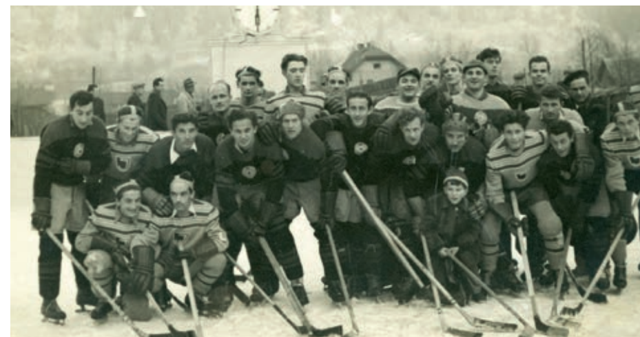
Prvi hokejisti po osvoboditvi so imeli naravni led na nogometnem igrišču.