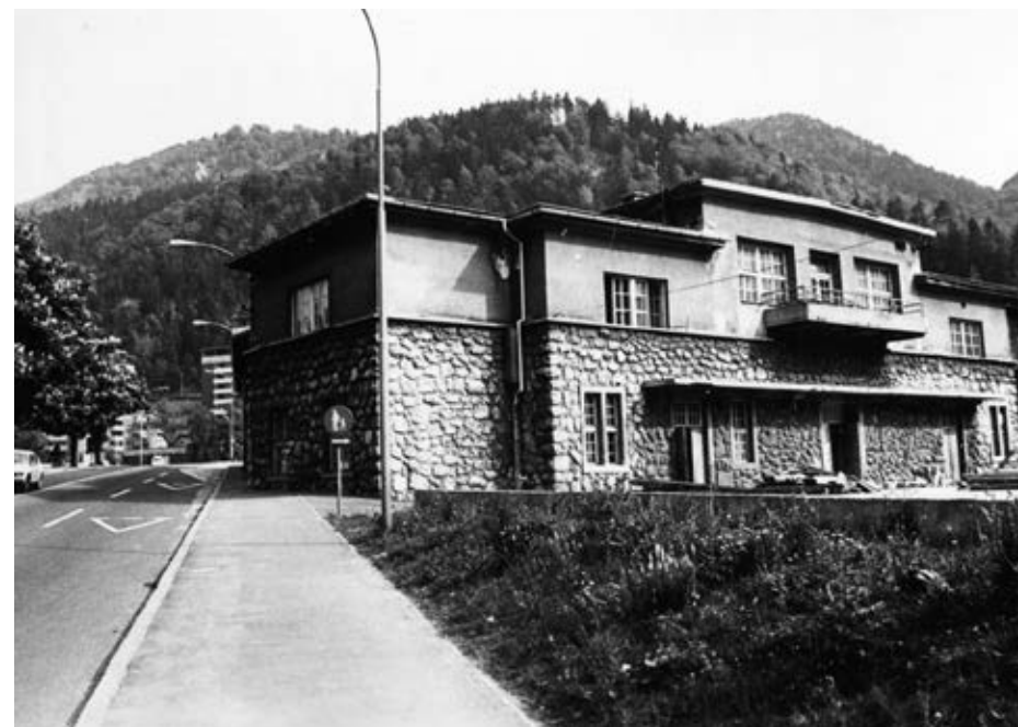
Stavba TVD Partizan Jesenice z južne strani, 1979