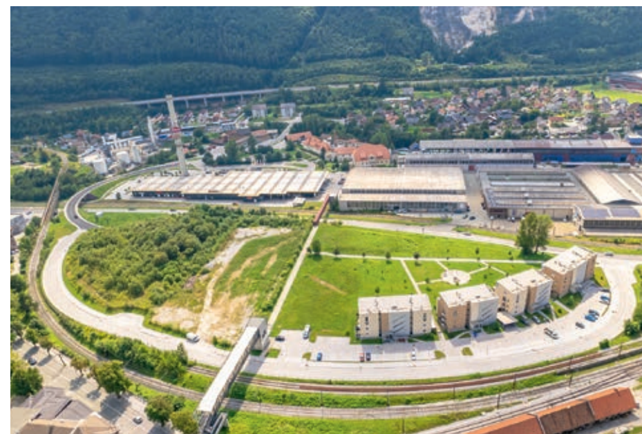
Območje Hrenovce danes, 2023

Aglomeracija je bila po ustavitvi plavžev leta 1987 nepotrebna, zato so jo leta 2001 porušili. V spomin na jeseniške železarje je Klub jeseniških študentov 8. decembra 2000 v enem od objektov aglomeracije pripravil koncert z glasbo in osupljivimi svetlobnimi efekti, ki so ponazarjali, kako umira staro in se poraja novo. Od zadnjih železarskih obratov v Hrenovci so se poslovili mladi, takratni in nekdanji železarji. Danes je območje Hrenovce urbana in stanovanjska soseska s štirimi večstanovanjskimi objekti, poimenovana Gorenjski sonček.