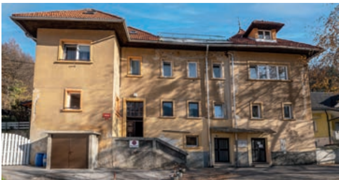
Čuferjev gradič