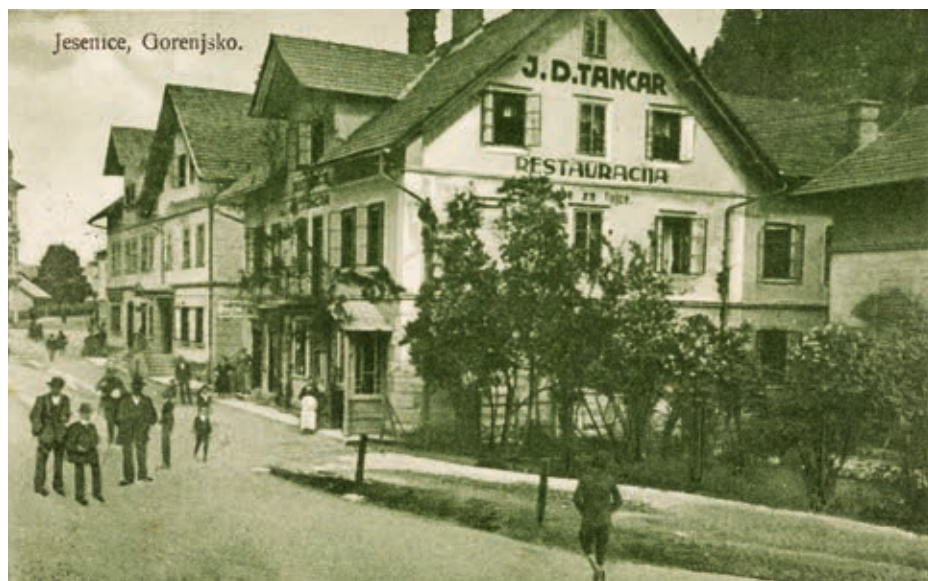
Tančarjeva hiša

Gimnazija Jesenice je bila ustanovljena v šolskem letu 1945/46. Prva štiri leta je pouk potekal v prostorih meščanske šole v stavbi, kjer je bila kasneje kemična čistilnica. Leta 1949 se je gimnazija preselila v današnjo stavbo, ki je takrat dobila ime Gimnazija. Prostore je sprva delila z osnovno šolo do izgradnje nove šolske stavbe na Tomšičevi ulici leta 1959 (današnja OŠ Prežihovega Voranca). Do šolske reforme leta 1958 se je gimnazija delila na nižjo (do 4. razreda) in višjo (od 5. do 8. razreda). V naslednjih desetletjih se je razvila v dobro pripravljajnico za študij na univerzi in se opazno uveljavila v kulturnem, športnem in družabnem življenju na Jesenicah. Tako je še danes.