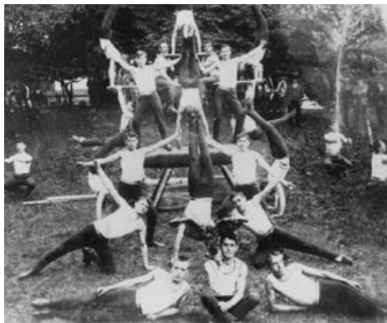
Nastop Telovadnega društva Sokol Jesenice na Ferjanovem vrtu, 1905

Organizirano športno življenje se je začelo ob koncu 19. in v začetku 20. stoletja, ko so se na Jesenicah ustanovila posamezna kulturno-športna društva (podružnica nemškega telovadnega društva Turnverein (Turnarsko društvo), Telovadno društvo Sokol, Telovadno društvo Orel, Telovadno-kulturno društvo Svoboda, Planinsko društvo Prijatelji prirode, Turistovski klub Skala ...). V društvih je posebno mesto zasedala telovadba.