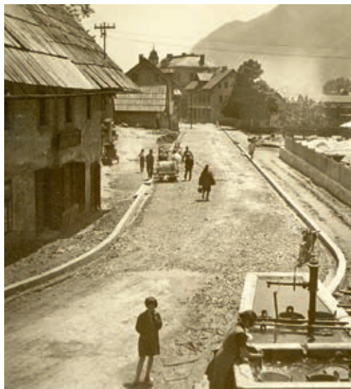
Gosposvetska cesta, 1929. Na fotografiji je viden kostanj, ki še danes stoji med stolpnici nasproti parka.

Meščansko arhitekturo in spomine na nekdanje življenje mesta in njegovih prebivalcev srečamo tudi na ulici južneje, ki je bila v tesnem sožitju z Murovo. To je nekdanja Gosposvetska cesta, ki poteka od potoka Jesenica na zahodu do nekdanje Tancarjeve hiše (danes Restavracija Ejga) na vzhodu. Temu območju domačini pravijo »stare Jesenice«.