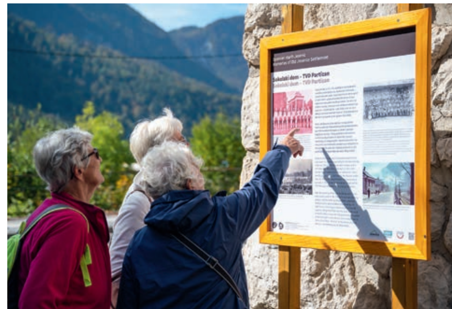
Informacijska tabla na poti (hrani RAGOR)