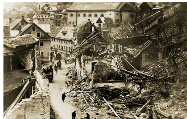
Gospovetska cesta po bombardiranju, 1945