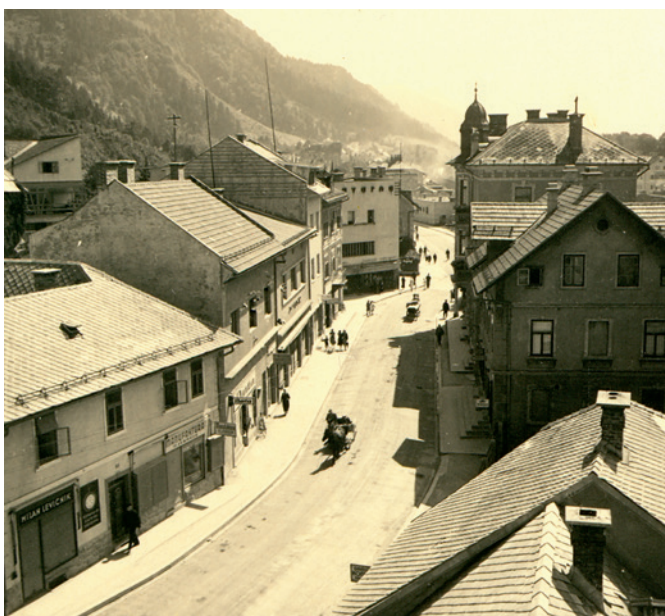
Gospovetska cesta, 1935 – 1937

Tematska pot Spomini starih Jesenic se prične z lahkotnim sprehodom po Murovi. Arhitektura, običaji in vsakdan naših prednikov ponujajo svojo pestrost tudi na ulici južneje, ki je bila v tesnem sožitju z Murovo. To je nekdanja Gospovetska cesta med Kosovo graščino in Korotanom. Območju obeh ulic domačini pravijo ta stare Jesenice .