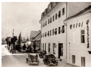
Hotel Pošta, ok. 1948