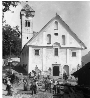
Župnijska cerkev, 1931