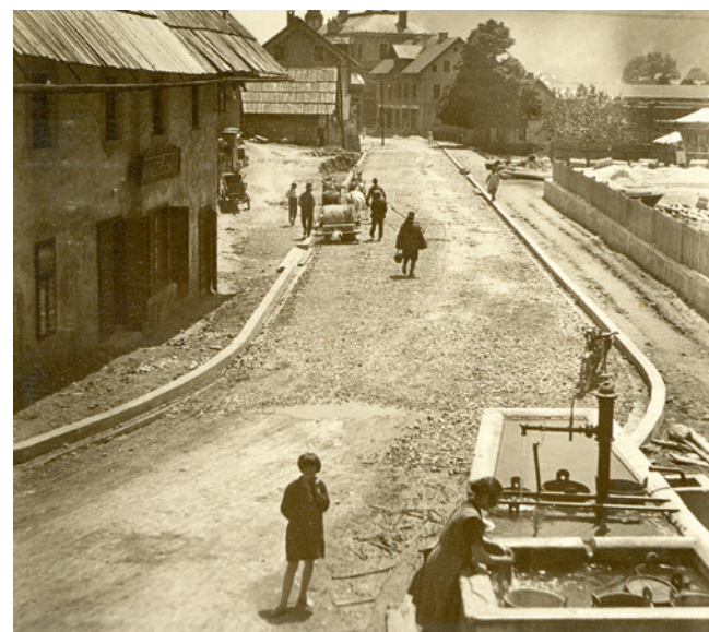
Gospovetska cesta, 1929