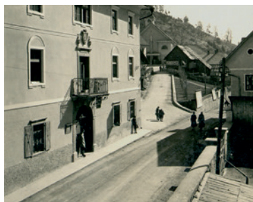
Kosova graščina pred 2. sv. vojno