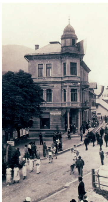
Hotel Triglav, 1929