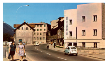
Hotel Korotan, 1970-ta