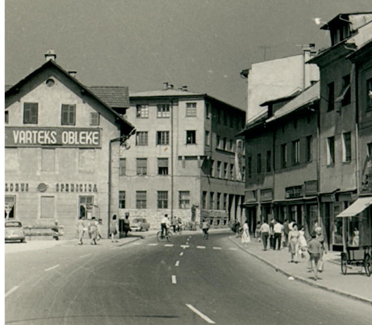
Jesenice, ok. 1980