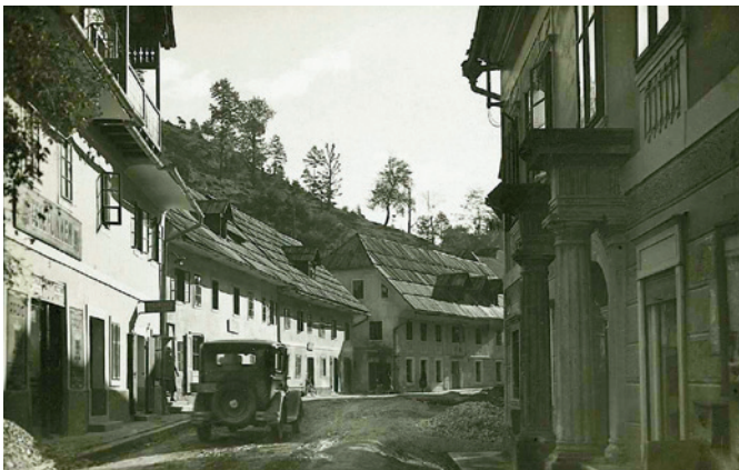
Gospovetska cesta, 1937

Tematska pot Spomini starih Jesenic se prične z lahkotnim sprehodom po Murovi. Arhitektura, običaji in vsakdan naših prednikov ponujajo svojo pestrost tudi na ulici južneje, ki je bila v tesnem sožitju z Murovo. To je nekdanja Gospovetska cesta med Kosovo graščino in Korotanom. Območju obeh ulic domačini pravijo ta stare Jesenice .