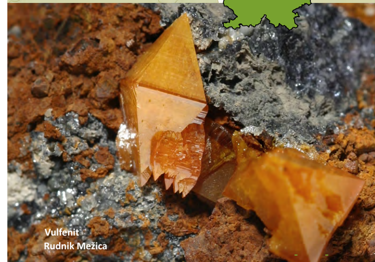
Vulfenit Rudnik Mežica